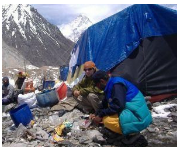
Ambiente/Ghiacciaio Baltoro e K2 ripuliti da 8 tonnellate rifiuti Smaltiti da Earth, smaltitore ecologico nuova generazione

Islamabad, 28 lug. (Apcom) - Otto tonnellate di rifiuti, tra carta, plastica, lattine, vetro e materiali tossici portati a valle: questi i primi risultati dell'operazione "Keep Baltoro Clean", avviata dal Comitato EvK2Cnr nell'ambito del progetto Karakorum Trust, per ripulire il ghiacciaio del Baltoro, in Pakistan, e i campi alti delle montagne che vi si affacciano. Solo nel 2008, sono passate per il Karakorum 95 spedizioni alpinistiche e quasi 5000 trekkinisti. Da diverse stagioni Karakorum Trust e il Pakistan Alpine Club organizzavano la "Baltoro clean up expedition" per la pulizia del ghiacciaio più celebre del Karakorum. Ma finora la pulizia riguardava solo i campi base delle numerose spedizioni alpinistiche. Da quest'anno, invece, anche i campi alti. I primi risultati di questa iniziativa sono stati presentati ieri a Islamabad con una conferenza stampa alla quale hanno preso parte i vertici del Pakistan Alpine Club, Agostino Da