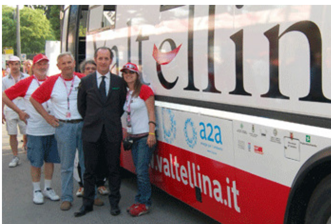
il Ministro delle Politiche Agricole Zaia vicino al motorhome "Valtellina"

Un secolo di storia per una corsa che attraverso le sue tappe ha fornito un contributo importante anche nella promozione e valorizzazione dei nostri territori.