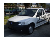
Logan PU 1500 DCI 70cv