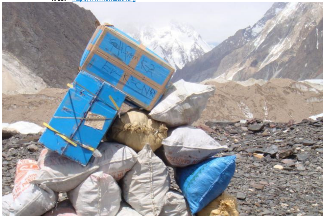
Foto di copertina: Rifiuti provenienti dal ghiacciaio