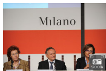
Clima: che aria tira in montagna?

«Si tratta di un progetto di valenza scientifica straordinaria - ha detto poco fa il Ministro per l'Istruzione, l'Università e la Ricerca Maria Stella Gelmini alla conferenza stampa di presentazione dell'evento -. Un paradigma di come affrontare la ricerca, fare rete e squadra, nonchè instaurare collaborazioni virtuose tra pubblico e privato. EvK2Cnr ha messo in campo una straordinaria capacità di programmazione individuando tematiche globali ma anche quotidiane. Nei prossimi anni vedremo come la ricerca sia legata e abbia ricadute sulla vita di tutti i giorni con effetti molto concreti».