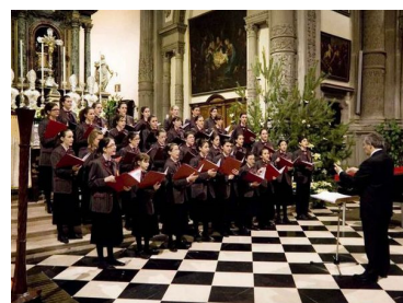
Il coro dei Piccoli Musici in concerto nella chiesa di Santo Spirito a Bergamo