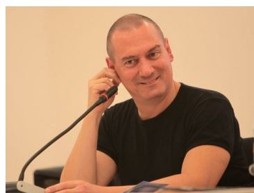
Lo scrittore Raul Montanari chiude a Villa di Serio il Festival dei narratori italiani