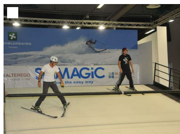
Il tapis roulant per sciare ad Alta Quota

Un gigantesco tapis roulant per sciare, una pista di pattinaggio con ghiaccio «sintetico», lo scarpone da scialpinismo più leggero al mondo: 620 grammi. Sono queste alcune delle novità in cui gli appassionati di montagna e sport invernali potranno imbattersi alla sesta edizione di Alta Quota la fiera della montagna che è stata inaugurata venerdì pomeriggio 2 ottobre alla presenza di tantissime autorità.