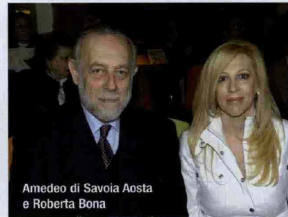
Amedeo di Savoia Aosta e Roberta Bona