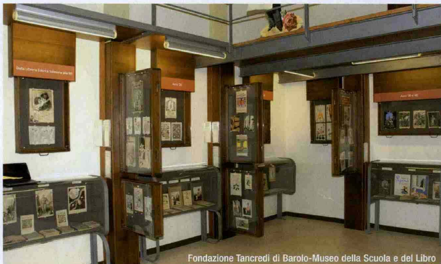
Fondazione Tancredi di Barolo-Museo della Scuola e del Libro